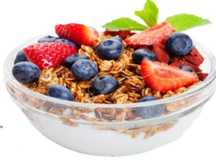
logurt casolà amb muesli i fruites Yogur Casero con muesli y frutas rojas Home made yogurt with muesli & berries