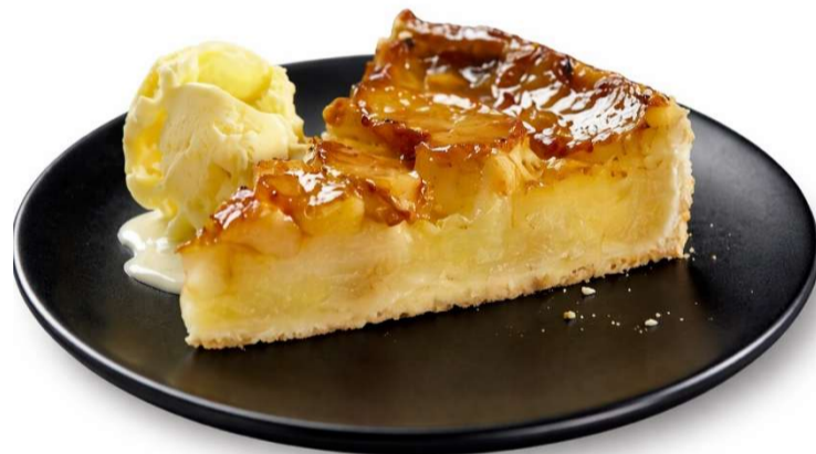
POMA amb gelat de vainilla MANZANA con helado de vainilla APPLE/POMMES vanilla ice cream