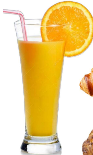
SUC DE TARONJA NATURAL 5,00 €