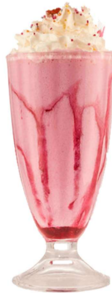
Batuts/ Batidos Ice cream Milk Shakes