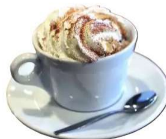
Cafè Cap d'Or